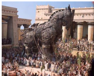
Caballo de Troya (La Iliada)