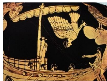
Ulises atado al mástil (La Odisea)