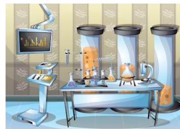
Sala de laboratorio