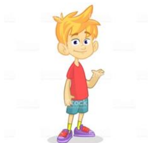
Mateo (personaje principal)