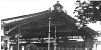
Estación central. Santiago, Chile.

En 1750 comienza el abaratamiento de la producción del hierro bruto, la máquina a vapor estaba tan desarrollada que podía procesar el hierro. Es durante esta época que comienza a desarrollarse la Arquitectura de Ingeniería , que se caracteriza por la ligereza, la transparencia, el efecto de tensión y fragilidad creadas por estas construcciones metálicas. El principal exponente de este período es el arquitecto Gustave Eiffel , creador de la famosa Torre Eiffel de París . En Chile la Estación Mapocho y el Museo Arlequín son representativos de este estilo.