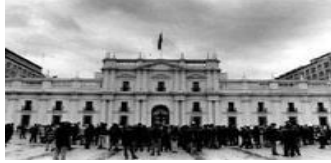
El Palacio de la Moneda

El Palacio de la Moneda diseñado por Joaquín Toesca es principalmente de estilo Neoclásico, con escasa decoración en su fachada. La Biblioteca Nacional que representa el espíritu de la Ilustración, tiene en su fachada la típica columna falsa , es decir que esta adosada a un muro y no cumple su función de sostener, sino que solo de decorar y rememorar los tiempos griegos.