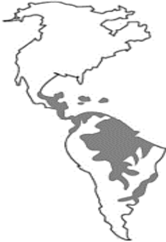
Mapa climas cálidos

LA SABANA: Está presente solo en América del Sur. Corresponde a una extensa llanura donde crecen árboles bajos y abundante hierba.