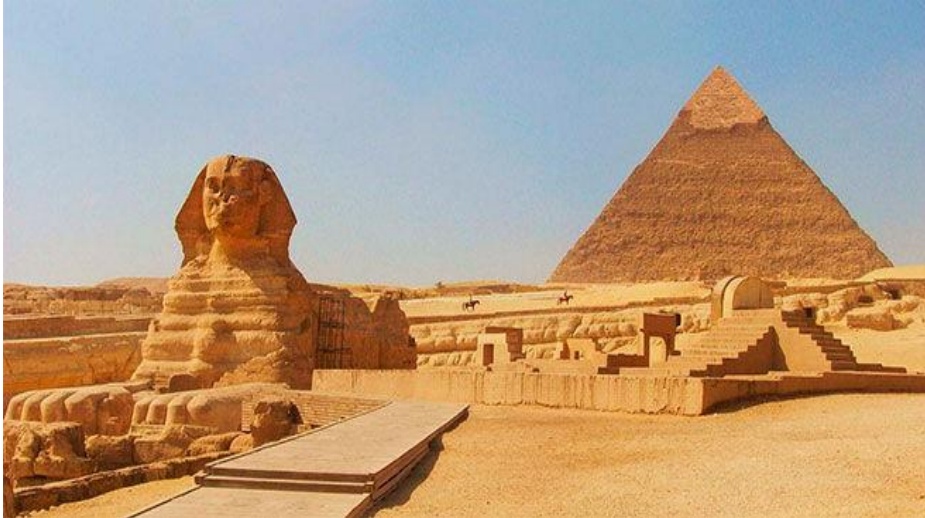
Gran Esfinge de Guiza, Egipto

I- Observa las imágenes. Luego responde.