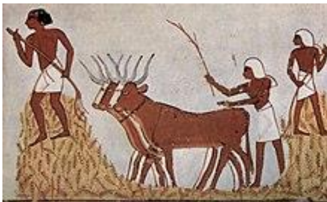
Pintura cámara funeraria. Corte de grano y ganadería.