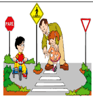
Enseñar reglas del tránsito