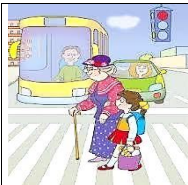
Ayudar a una anciana

Actividad N°1: Encierra en un círculo rojo las acciones que ayudan a la buena convivencia en tu comunidad.