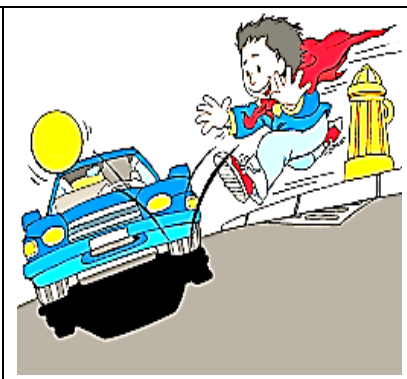
Jugar en la calle