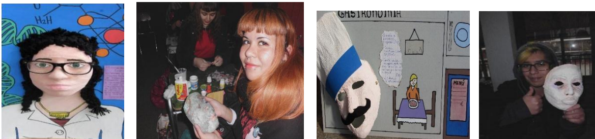
Trabajos desarrollados por alumnos del Colegio Fernando de Aragón (año 2018)

-Construcción de Identidad (Expectativas Profesionales) Modas y Estilos (urbanos, por ejemplo), Emocionales y Afectivos, etc., utilizando como referente las Especialidades Técnicas impartidas por el colegio (carreras de Enfermería, Gastronomía, Contabilidad y Administración ), inspirados en personajes cinematográficos).