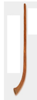
Bastón de madera.