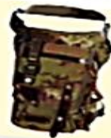
morral: saco o bolso de cazador.