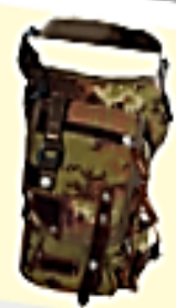
morral: saco o bolso de cazador.

TE INVITO A LEER “HISTORIA DE POR QUÉ LA LLOICA TIENE EL PECHO COLORADO” DE MARTA BRUNET, QUE ESTÁ EN LA PAGINA 127 Y 128 DEL TEXTO DE LENGUAJE.