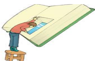
Esta foto de Autor desconocido está