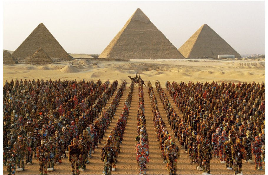
HA Schultz, Trash People , El Cairo, 2002