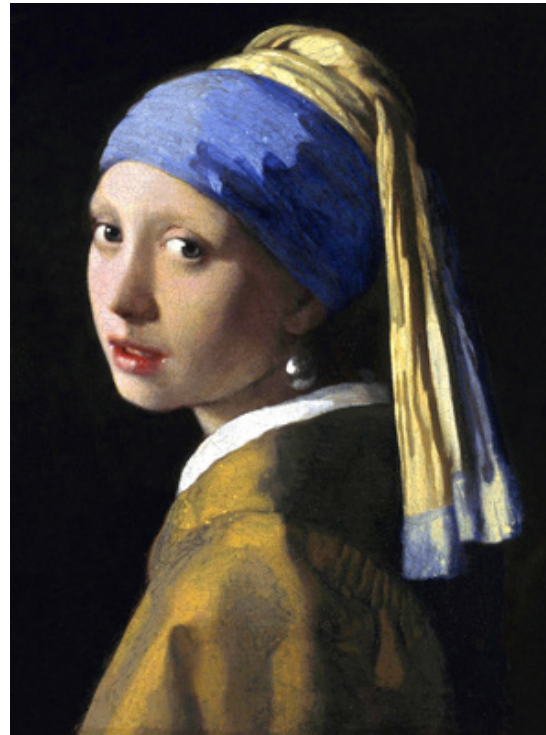
Johannes Vermeer, La Joven de la Perla , 1665-1667