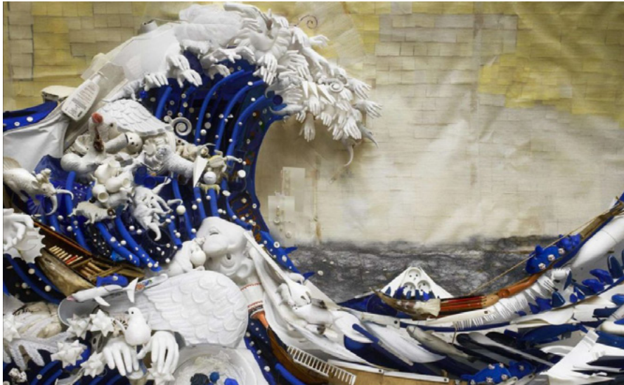
Bernard Pras, La Ola , 2007