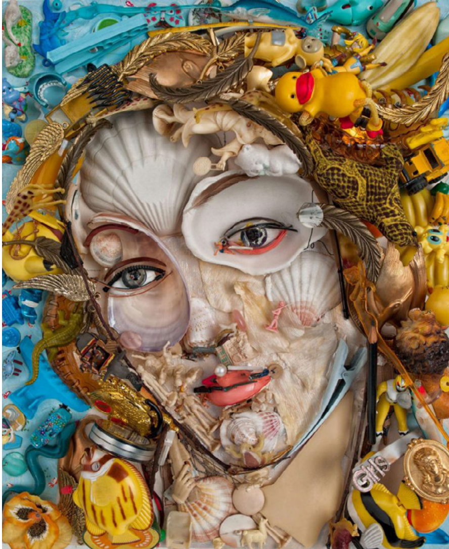
Bernard Pras, Venus, 2014

Ahora te invitamos a contribuir, a través del arte, a reciclar, reducir y reutilizar diferentes objetos para realizar una gran obra en casa. ¿Te animas? Despierta tu imaginación y creatividad. ¡Sé un guardián del planeta o un niño/a eco!