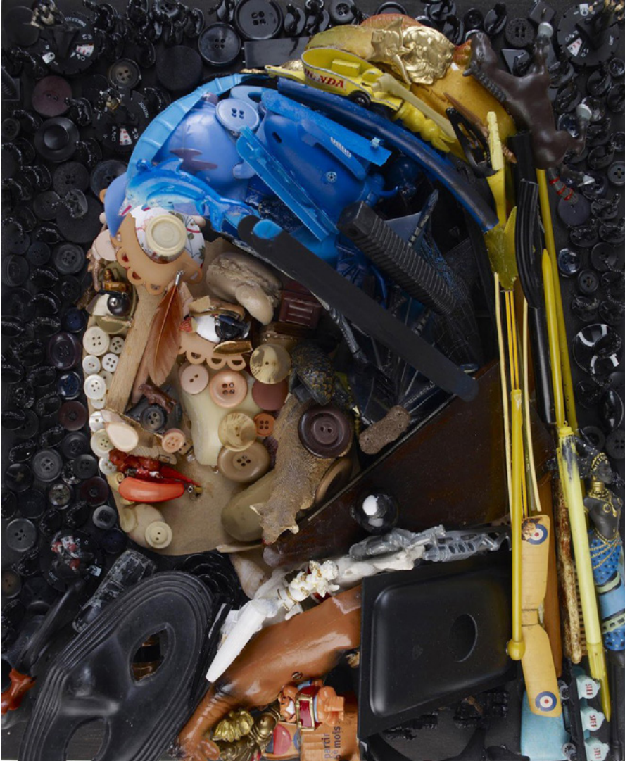
Bernard Pras, La Joven de la Perla , 2013