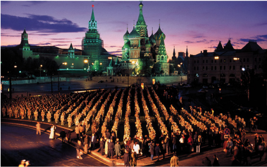
HA Schultz, Trash People , Rusia, 2001