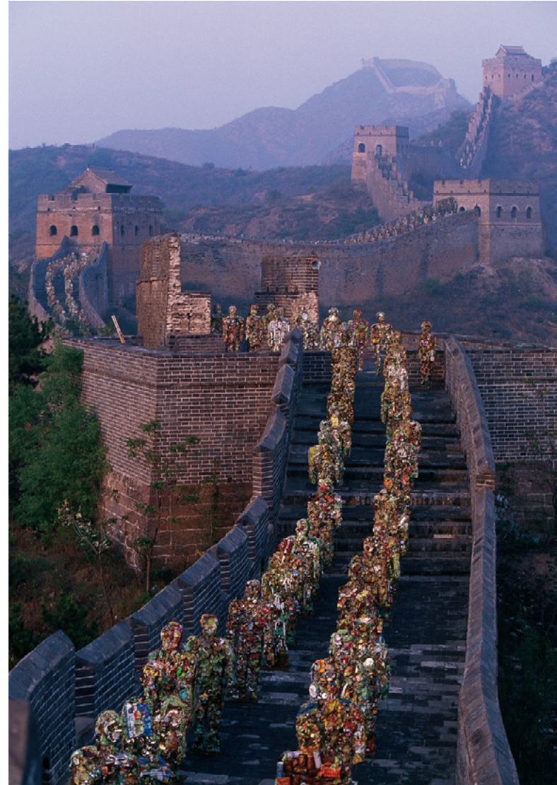
HA Schultz, Trash People, 2001

También ha mostrado su obra en otras partes del mundo como Rusia, en la plaza Roja de Moscú y en otra oportunidad, frente a las Pirámides de Giza en el Cairo, ¿impresionante no? ¿Se te habría ocurrido hacer algo así? ¿Logras dimensionar la cantidad de residuos que generamos a diario?