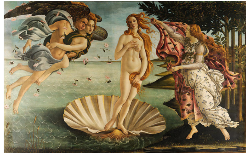
Sandro Botticelli, El Nacimiento de Venus, 1485-1486