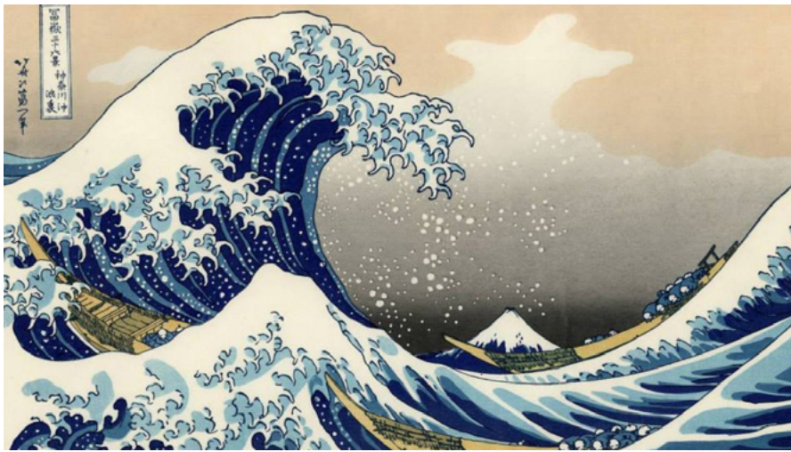
Katsushika Hokusai, La Gran Ola de Kanagawa , 1829-1833