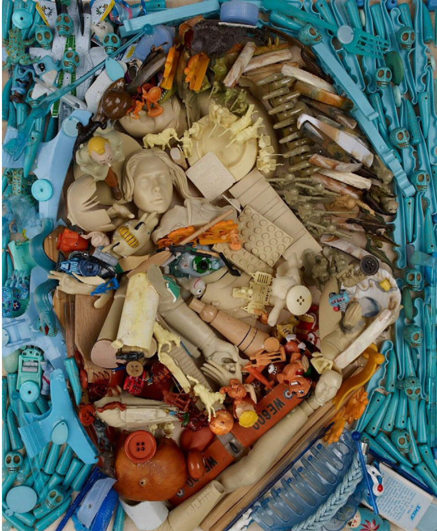
Bernard Pras, Van Gogh, 2013