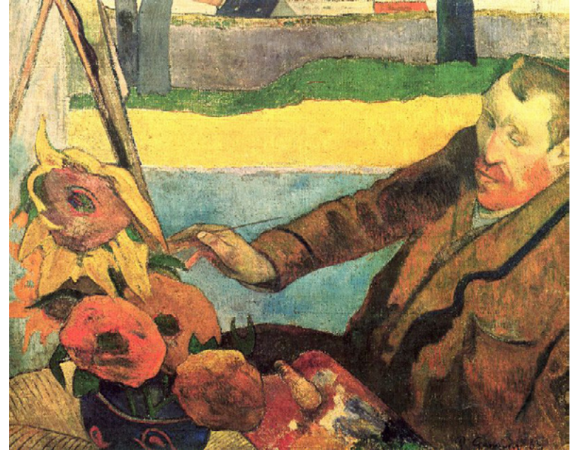
Paul Gauguin, Van Gogh pintando girasoles , 1888

Ahora que conocemos un poco más sobre el retrato, te invitamos a experimentar con divertidas actividades que preparamos para ti, ¡manos a la obra!