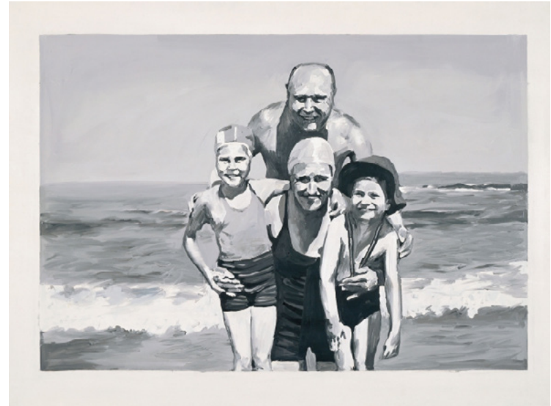
Gerhard Richter, Familia en el mar , 1964