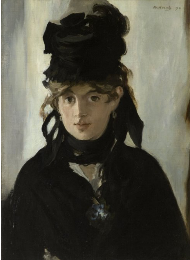
Edouard Manet, Berthe Morisot , 1870

Y por supuesto, los y las artistas también realizaron obras a sus grandes amigos y amigas, por ejemplo, los artistas impresionistas fueron un grupo de pintores que buscaba la representación de la luz por medio del color, querían representar lo que veían las cosas en la realidad. En esta búsqueda se unieron varios y varias interesadas, quienes exponían juntos sus obras, de esto también nacieron grandes amistades. Esta obra la realizó Edouard Manet, a su amiga también pintora Berthe Morisot.