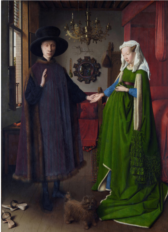
Jan van Eyck, Retrato de Giovanni Arnolfini y su esposa, 1434

Como les comentábamos, con el pasar de los siglos los y las artistas representaron también a personas cercanas, ya no se preocupaban solamente de personajes importantes de la sociedad, pues la familia, los amigos y claro, nosotros mismos, también somos importantes como para ser pintados ¿no te parece?