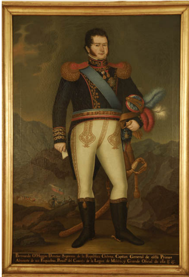
José Gil de Castro, Retrato del Capitán General Bernardo O'Higgins Riquelme, Museo Histórico Nacional