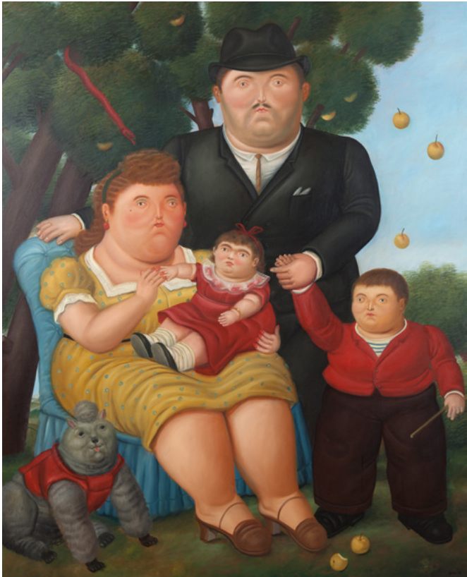
Fernando Botero, La familia , 1989