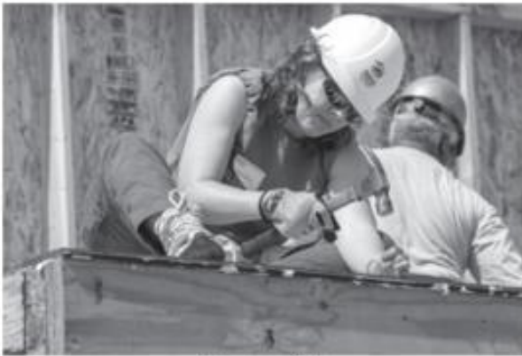
Techo para Chile