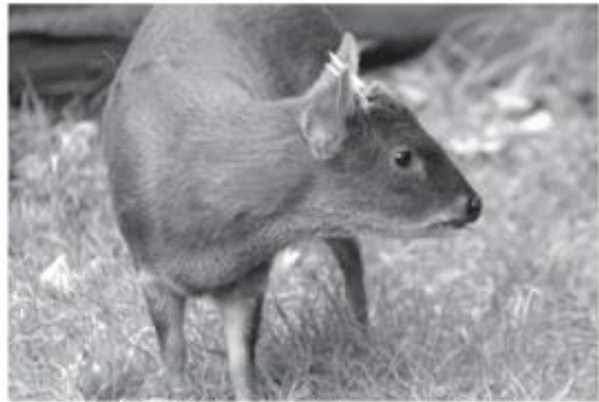
CODEFF. Comité Nacional Pro Defensa de la Flora y Fauna

"Volunteers are not paid -- not because they are worthless, but because they are priceless."