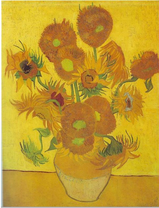
"Girasoles" Vincent Van Gogh