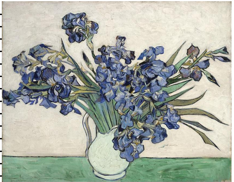
"irises" Vincent Van Gogh