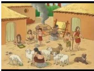
Galá, yariara emha aq'uuboo

Eran los pueblos que permanecían en un lugar fijo, ellos construían sus propias casas, además obtenían sus propios alimentos por medio de la agricultura, de la ganadería y también fabricaban sus propias herramientas.