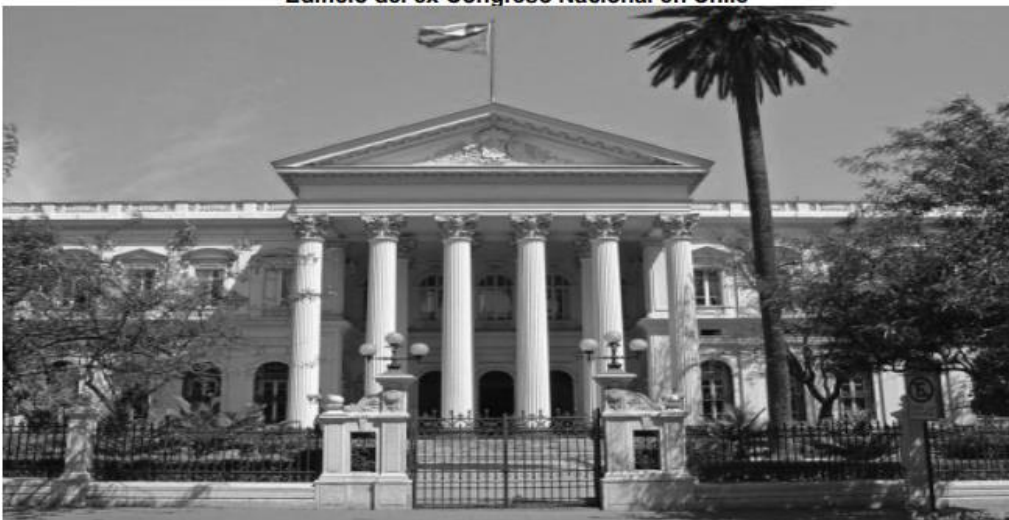
Edificio del ex Congreso Nacional en Chile

20- ¿Qué aspecto del legado del mundo clásico se encuentra presente en esta imagen?