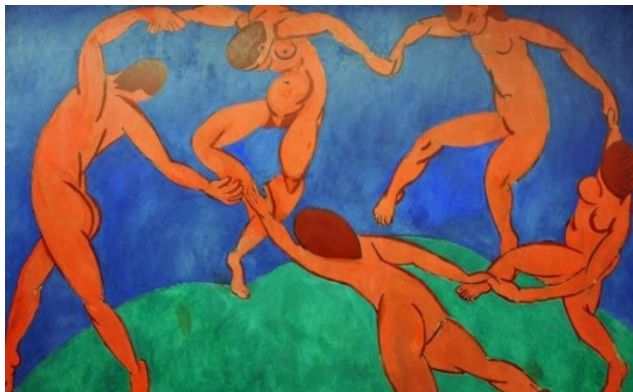
“La danza” Henri Matisse

Se pasaba horas mirando sus formas recortadas, creando es su cabeza nuevas composiciones. cuando ya tenía clara la composición, y con ayuda de alfileres, chinchas y pegamento, las fijaba formando siluetas, hojas de acanto, flores de nieve o la forma sinuosa de su famoso caracol. Creo muchos otros cuadros con recortes llenos de colores.