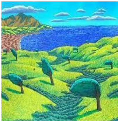
Árboles con viento Autor: Sebastian Garretón Técnica: óleo sobre tela

Sebastián Garretón (1962) es uno de los pintores chilenos jóvenes que ha dedicado gran parte de su obra a la representación del paisaje nacional, el que puebla de personajes o situaciones que refieren la identidad del país, a través de elementos del expresionismo, la ironización de la estética naïf y la figuración. Árboles con viento , es un destellante paisaje compuesto por elementos bien definidos en el color y la forma, que recuerda la estética infantil de los dibujos escolares. Tonos profundos capturan el movimiento de las copas de los árboles y el mar, mecidos por el viento. Pero el orden en la disposición de los elementos del cuadro, contrasta con la inclinada y exagerada posición de los arboles.