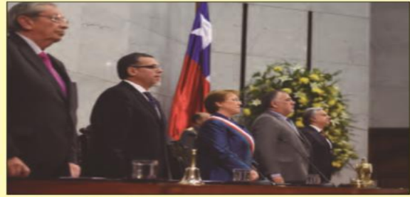
Cuenta pública 21 de mayo