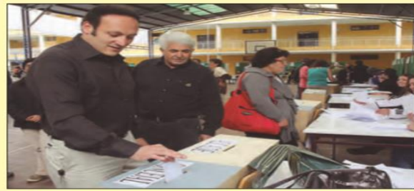
Elecciones presidenciales y parlamentarias