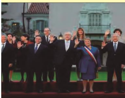
Gabinete presidente Michelle Bachelet