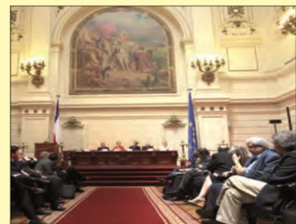
Sesión plenaria del Senado