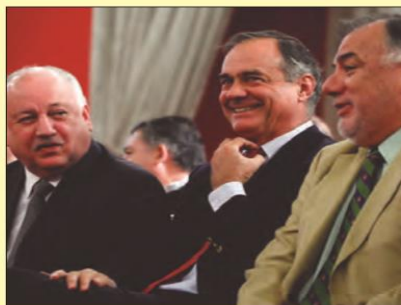
Presidentes de Partidos de la Nueva Mayoría