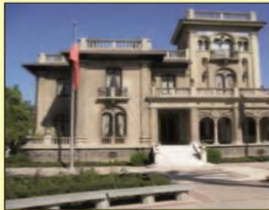
Municipalidad de Providencia