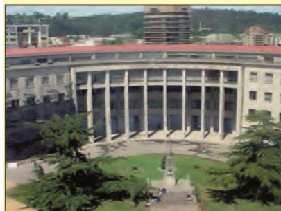
Tribunales de Justicia de Concepción