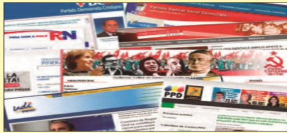
Partidos políticos en Chile