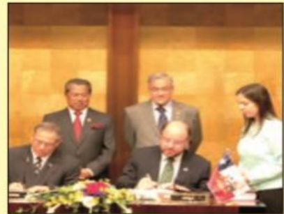
Firma Tratado Libre Comercio entre Chile y Malasia