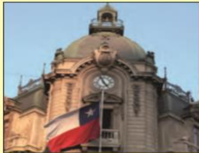
Intendencia de Santiago