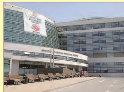
Hospital Regional de Temuco