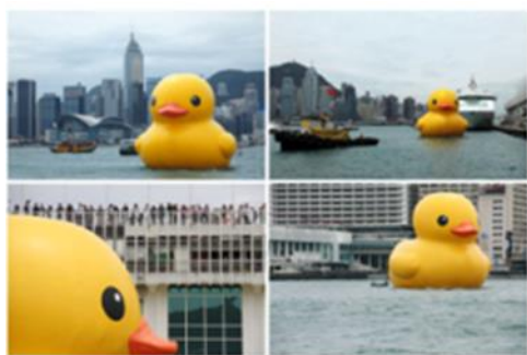
Florentijn Hofman :”Pato de Hule”

En la guía de hoy revisaremos un género del ARTE CONTEMPORÁNEO: LA INSTALACIÓN ARTÍSTICA, que abarca diversos medios técnicos y problemáticas, desde el aspecto ecológico o medioambientalista hasta lo contingente - social, existencial, etc., donde se busca principalmente que los espectadores se involucren e interaccionen con ella, en una experiencia estética completa e integral y fundamentalmente reflexiva.