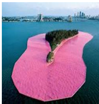
Christo: “Surrounded Islands”