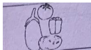
tomate, pimentón, berenjena