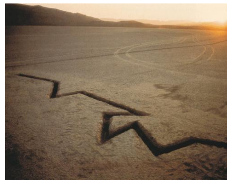
El lago Jean Dry, al sur de Las Vegas, ha absorbido totalmente Rift 1 (1968), primera de obras realizada por Michael Heizer de su serie Nine Nevada Depressions

El Land art es una corriente del arte contemporáneo que utiliza materiales de la naturaleza (madera, tierra, piedras, arena, viento, rocas, fuego, agua...) así como el marco del paisaje natural para desarrollar sus obras artísticas. Una corriente que comenzó a gestarse en los años sesenta con algunas obras realizadas en los paisajes desérticos del Oeste de EE.UU. en lo que parece que fue una respuesta por parte de algunos artistas al rentabilísimo negocio en el que se había convertido el mundo del arte y su manera de valorar el objeto artístico únicamente como objeto canjeable y no por su valor artístico.