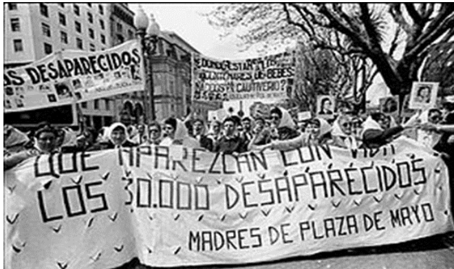
Manifestación por los detenidos desaparecidos, Buenos Aires – Argentina (1982)

A continuación, analizaremos algunos factores que llevaron a que se concretara este proceso en nuestro país: