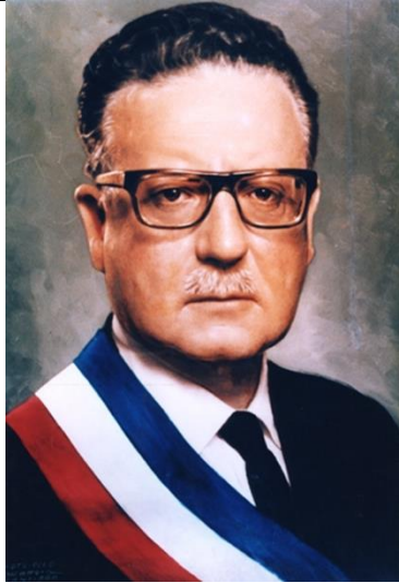
Salvador Allende – Presidente de Chile (1970-1973)

Es en este contexto que, en 1970, Salvador Allende se convierte en Presidente de Chile.