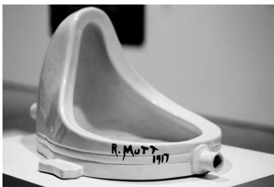
Marcel Duchamp “Urinario”

Muchos encuentran el origen de este género en artistas como Marcel Duchamp y el uso de objetos cotidianos resignificados en espacios de galerías y museos como obras artísticas. Sin embargo, se puede decir que el más cercano precedente está dado en los Environments (ambientes).