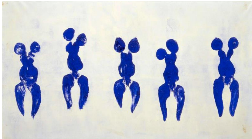
Antropometría Yves Klein

Otro antecedente interesante puede ser la exposición de 1958 en París del artista francés Yves Klein que consistía en una habitación vacía y aunque el término no surgió hasta la década de 1970, este gesto es a veces visto como la primera instalación, en el sentido en que se entiende el término en la actualidad.