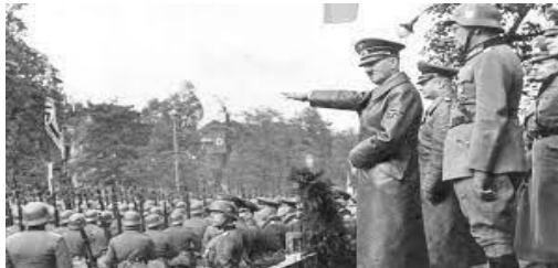
Segunda Guerra Mundial. Tropas alemanas desfilan frente a Adolfo Hitler

Sin embargo, esto no tuvo demasiado éxito, ya que ahora los derechos se mantuvieron reservados mayormente para los grupos de comerciantes que tenían más dinero y educación, a los cuales se les denominara burgueses. En las leyes que se dictaron se aseguraron de que esta situación se mantuviera.