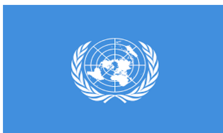
Bandera de las Naciones Unidas

Tendrían que pasar 160 años y una situación tan traumática como la Segunda Guerra Mundial, en la cual perdieron la vida entre 60 y 100 millones de personas y quedaron muchos países devastados y arruinados producto de este conflicto, para que se luchara por una nueva declaración que buscara que los gobiernos en sus leyes internas respetaran la vida, integridad y seguridad de las personas. Este documento fue elaborado por los países reunidos en la Organización de las Naciones Unidas siendo llamada “Declaración de los Derechos Humanos”. En ese día, 48 países votaron a favor, ocho en contra y se abstuvieron dos (no votaron porque no estaban presentes.)