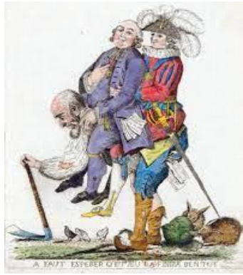
Caricatura del siglo XVIII que muestra al pueblo soportando el peso del alto clero y la nobleza

A partir del siglo XVIII (1700 a 1799) surge un grupo de audaces intelectuales pertenecientes a una corriente de ideas llamada ilustración, que comienzan a cuestionar el orden existente y comienzan a plantear un nuevo modelo de sociedad en la cual los seres humanos vivan en libertad, igualdad y fraternidad y que el gobierno debe ser un gobierno del pueblo que busque esa nueva realidad. Estas ideas van a ser la base de la Revolución Francesa de 1789, en la cual va a surgir el primer documento inspirado en estos ideales: este documento es la “Declaración de los derechos del hombre y del ciudadano”.