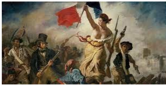
Cuadro: La libertad guiando al pueblo. Revolución Francesa

A partir del siglo XVIII (1700 a 1799) surge un grupo de audaces intelectuales pertenecientes a una corriente de ideas llamada ilustración, que comienzan a cuestionar el orden existente y comienzan a plantear un nuevo modelo de sociedad en la cual los seres humanos vivan en libertad, igualdad y fraternidad y que el gobierno debe ser un gobierno del pueblo que busque esa nueva realidad. Estas ideas van a ser la base de la Revolución Francesa de 1789, en la cual va a surgir el primer documento inspirado en estos ideales: este documento es la “Declaración de los derechos del hombre y del ciudadano”.