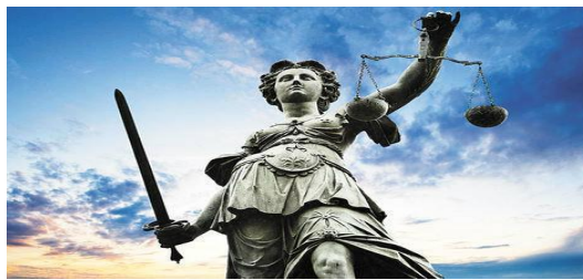
THEMIS, diosa griega representa la justicia y la equidad

Los segundos son los derivados del derecho positivo o escrito. Estos establecen reglas de conductas que son de carácter obligatorio y que están establecidas por el estado para regir la sociedad que dirige. Ejemplos de este tipo de derecho son las constituciones que tienen los diferentes países y si lo llevamos a tu vida diaria, estas normas regulan el matrimonio de tus padres, tu certificado de nacimiento y hasta tu certificado de estudio cuando pasas de curso.