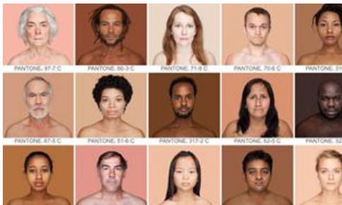
Angélica Dass(1979) Brasil

típico del campo chileno-, quien la observa y acompaña. La escena destaca por captar la esencia de la identidad campesina chilena, y también por los detalles con que reprodujo el traje del huaso y el paisaje local. Al reverso de un dibujo que Rugendas realizó sobre este mismo tema, aparece un breve diálogo entre los protagonistas, donde el huaso dice "¿con que lavando?" Ante lo que la lavandera responde ingenuamente: "y con jabón".