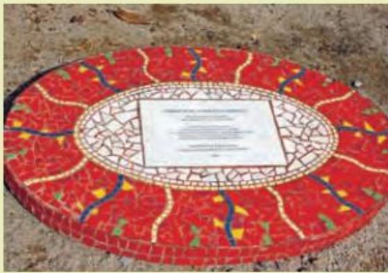
■ Mosaico construido en Parque de la Paz Villa Grimaldi, que durante la dictadura militar chilena fue utilizado como centro de torturas, que entrega un mensaje para que nunca más ocurra tortura en Chile, 2010.

1. ¿Qué temática representan las imágenes?