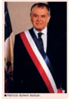
■ Patricio Aylwin Azócar.