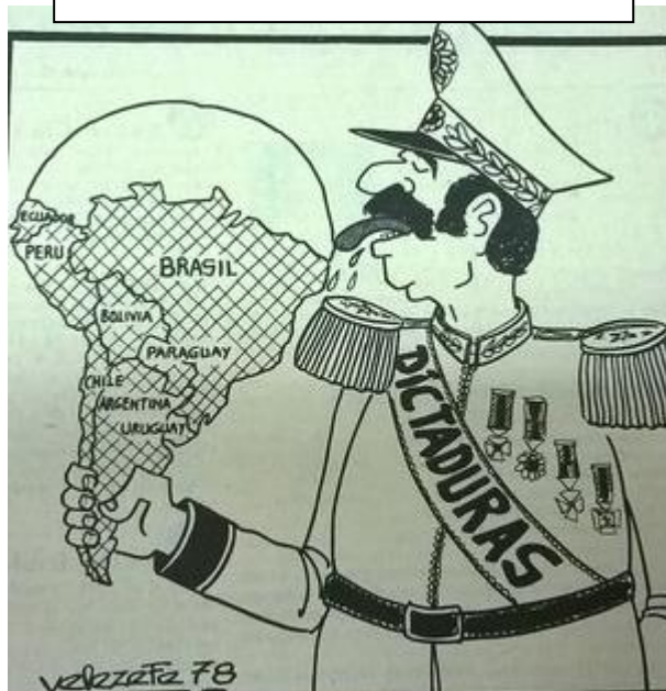
El cono suramericano por Velezefe.

Los principales gobiernos militares de América Latina fueron: