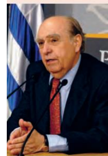
■ Julio María Sanguinetti.