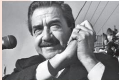
■ Raúl Alfonsín.