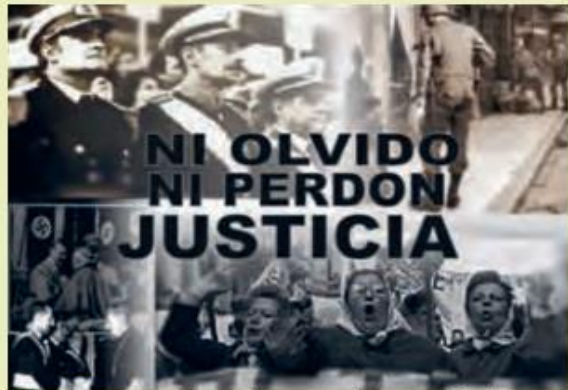
■ Cartel en contra de las acciones cometidas por la Junta Militar en Argentina.