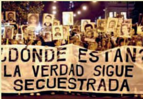
■ Marcha el año 2007 en Uruguay por los desaparecidos durante la dictadura de ese país entre 1973 y 1985.

I. Observa las imágenes y contesta las siguientes preguntas: