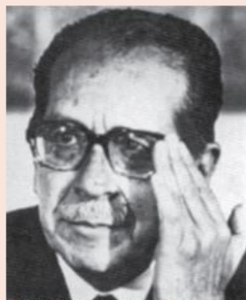
■ Hernán Siles Suazo.