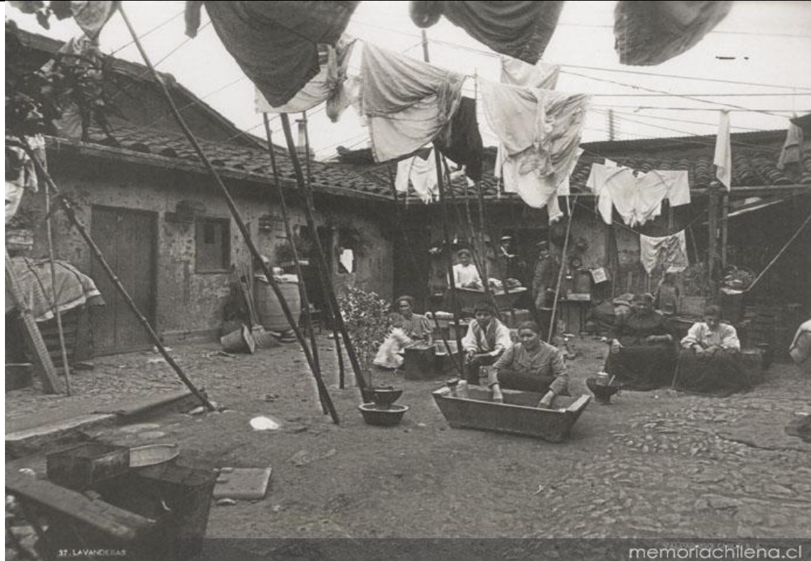
Lavanderas trabajando en el patio de un conventillo, Valparaíso, 1900

Según lo que observas en la imagen ¿Cómo vivían las personas a comienzos de los años 1900?