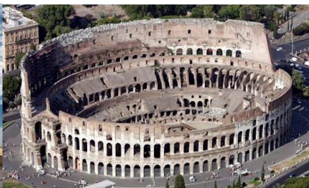
Ilustración 2- Coliseo Romano, Roma