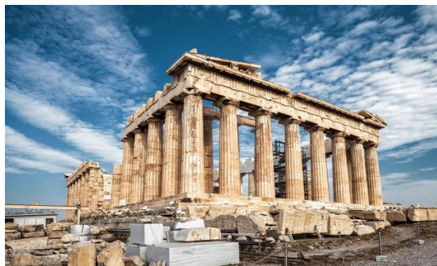
Ilustración 1 - Partenón en Atenas

Y por supuesto que nos han legado conocimientos y avances relacionados con otras disciplinas, como la Filosofía, el griego y el latín, la poesía épica y la poesía lírica, el teatro, la Historia, la Geometría, la Aritmética o la Medicina.