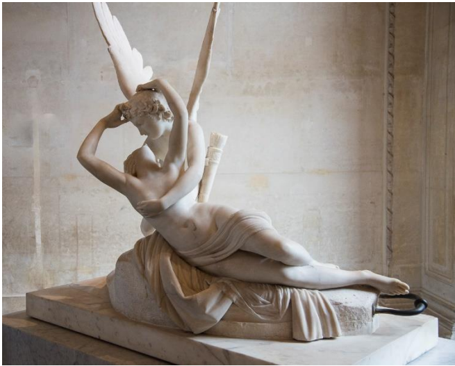
Ilustración 3- Escultura griega de Cupido y Psique