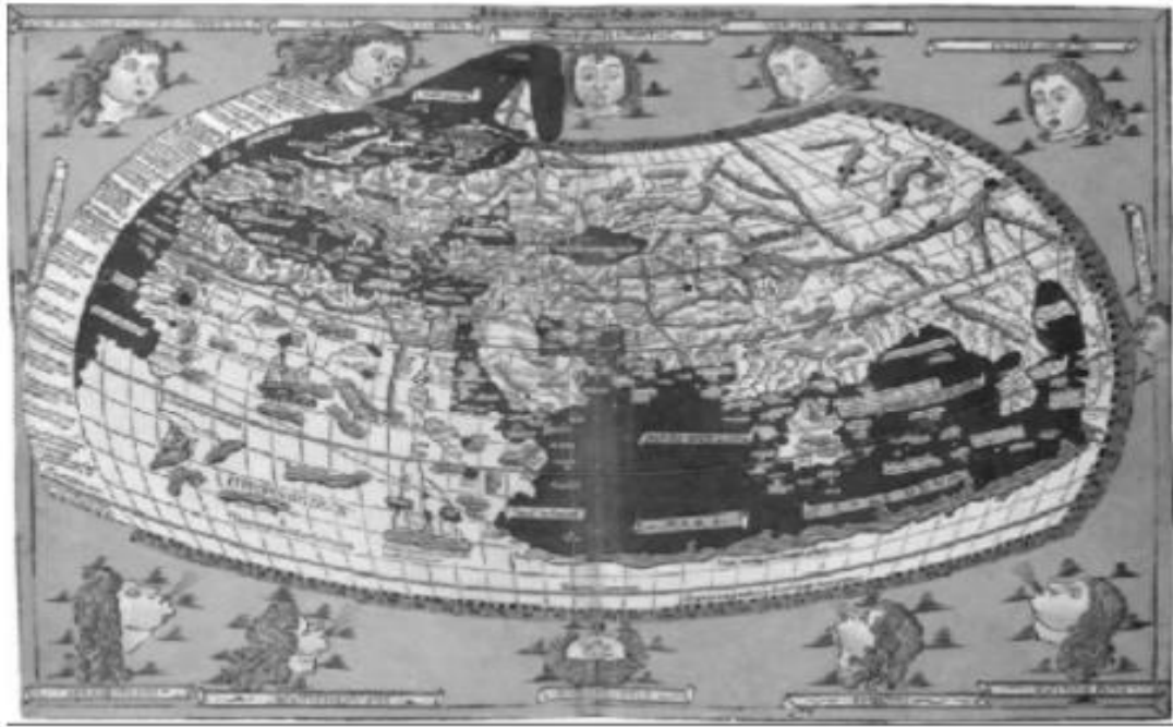
MAPAMUNDI SIGLO XV.