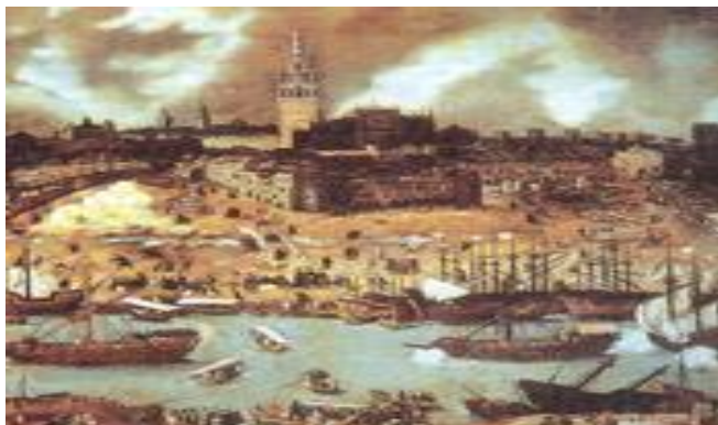
Ilustración 3 - CASA DE CONTRATACION DE SEVILLA

3.- Casa de Contratación: Creada en 1503.