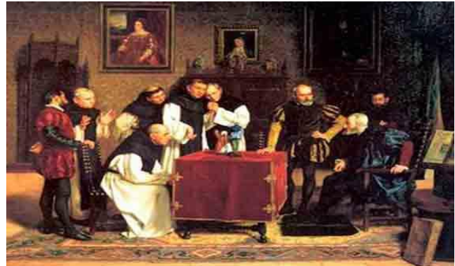
Ilustración 2 - CONSEJO DE INDIAS

2.- Consejo de Indias: El real y Supremo Consejo de Indias, que era su nombre exacto fue creado por el monarca Carlos V en 1524 (Carlos era nieto de Fernando de Aragón y de Isabel de Castilla, recibía los títulos de Carlos I de España y V de Alemania). Fue la institución de gobierno colonial más importante ya que asesoraba al rey en materias relacionadas con los aspectos ejecutivo, legislativo y judicial (En caso de que no recuerdes las diferencias de estos conceptos puedes consultar la guía número 8). Este organismo surgió de las necesidades de gobierno de la corona, y, desde los tiempos de los reyes católicos se hizo necesario un organismo que apoyara a los monarcas, con el tiempo fue aumentando en funcionarios, atribuciones e influencia hasta que como dijimos anteriormente Carlos V le dio su forma con la cual atravesaría casi todo el periodo colonial. En el XVIII perdió algunas atribuciones siendo suprimido en 1812, se le volvió a constituir en 1814 desapareciendo definitivamente el 1834. Su trabajo era tan cercano al monarca, que no tenía sede propia y debía estar donde el rey se encontrara, aunque en algunas materias excepcionales podía actuar en forma independiente del monarca.