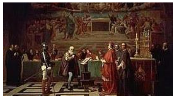
Ilustración 4 - TRIBUNAL DE LA INQUISICIÓN

4.- Tribunal de la Inquisición: Esta organización ya existía en España, pero fue implementada en América en 1569 por el monarca Felipe II, hijo de Carlos V. Su función era preocuparse de que las normas del catolicismo se aplicaran en nuestro continente, por lo tanto, funcionaba como un tribunal independiente de otras autoridades. Así, esta institución investigaba, perseguía y juzgaba a los herejes, invocadores del diablo, judíos, adivinos y hechiceros. En cuanto a la vida privada de las personas perseguía y castigaba a los infieles, bigamos y sacerdotes y frailes corruptos.