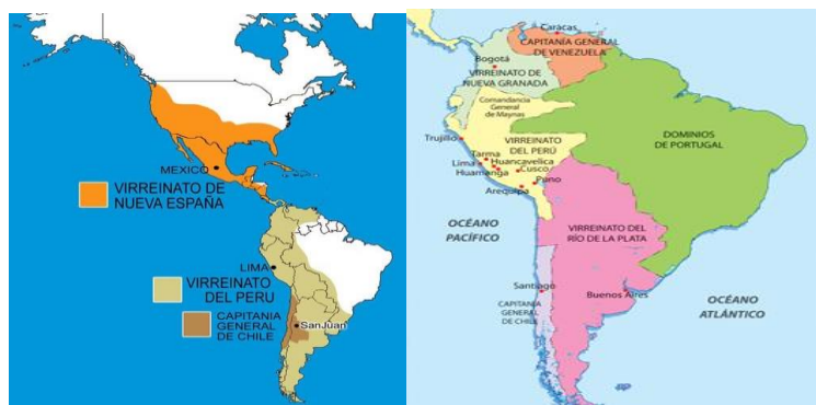
Ilustración 1 - DIVISION ADMINISTRATIVA DE AMERICA EN LOS SIGLOS XVI Y XVIII

Entonces, América fue colonia de España, que era su metrópoli entre los siglos XV (15) y XIX (19). Por lo tanto, como dijimos al comienzo, existió una estructura de gobierno colonial que garantizaba que los territorios se mantuvieran bajo el esquema de dominación y esta estructura estaba compuesta de las siguientes instituciones, las cuáles, algunas se encontraban en España y otras se encontraban en las colonias americanas.