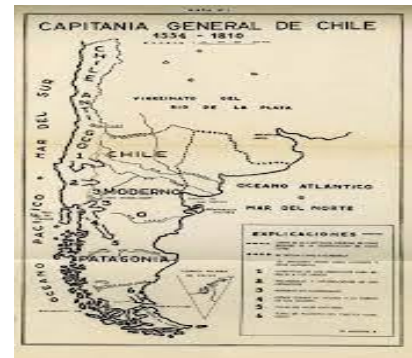
Ilustración 9 - MAPA DE LA CAPITANIA GENERAL DE CHILE

Las gobernaciones se dividían en dos, las primeras que se encontraban en territorios totalmente sometidos militarmente se les llama gobernaciones a secas, en cambio en aquellos territorios donde la población aborigen no se encontraba sometida y existía un estado de guerra o que por su ubicación estratégica fuera importante para la defensa del imperio español en América, se les llamaba Capitanías Generales. Este era el caso de Chile.