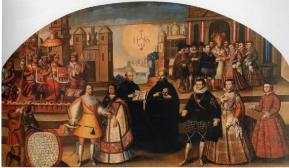
Ilustración 5 - UN VIRREY CON SU CORTE

Para América, si bien es cierto, se implementaron instituciones que ya existían en España, se les dotó de características y atribuciones de acuerdo a los nuevos territorios que se encontraban bajo la dependencia de España.