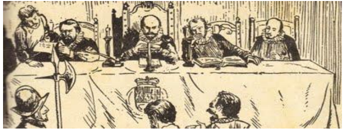
Ilustración 6 - REAL AUDIENCIA ENCABEZADA POR EL GOBERNADOR.

2.- Real Audiencia: Fue creado como el tribunal de justicia que operaba en cada una de las divisiones de América. Como se dijo, en un primer momento, sólo tenía atribuciones para aplicar justicia, pero a partir de 1542 se le ampliaron sus atribuciones hacia el gobierno para controlar los actos de virreyes y gobernadores.