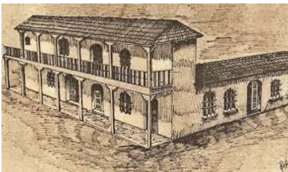
Ilustración 11 - CASA DEL CABILDO DURANTE LA COLONIA EN CHILE

6.- Cabildo: Era la institución que representaba a los vecinos frente a las autoridades nombradas por el monarca e inclusive hasta el mismo monarca. Si recordamos las guías anteriores para fundar una ciudad en un nuevo territorio, el capitán de conquista debía conformar un cabildo con al menos 30 vecinos que eran parte de su hueste y que debían manifestar por escrito su intención de quedarse en ese territorio como colonos. Esta institución vecinal que existía en España fue establecida en América como organismo de defensa de los españoles frente a las arbitrariedades o leyes que consideraban que no eran convenientes para sus intereses. El Cabildo tenía el llamado derecho a suplica que