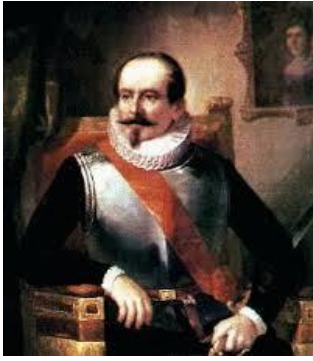
Ilustración 8 - GOBERNADOR ALONSO DE RIBERA

4.- Gobernaciones: Fueron subdivisiones territoriales más pequeñas, su origen se remonta a los inicios de la exploración y asentamiento de los españoles en nuestro continente, cuando el capitán de conquista y su hueste se establecía un territorio formando un cabildo y solicitaba al rey o al virrey la oficialización del nombramiento como fue en el caso de Pedro de Valdivia. Otro caso es cuando el capitán de Conquista ya poseía el título de gobernador otorgado directamente por el rey o por el virrey para ocupar militarmente un territorio y asentarse con su hueste en el mismo.