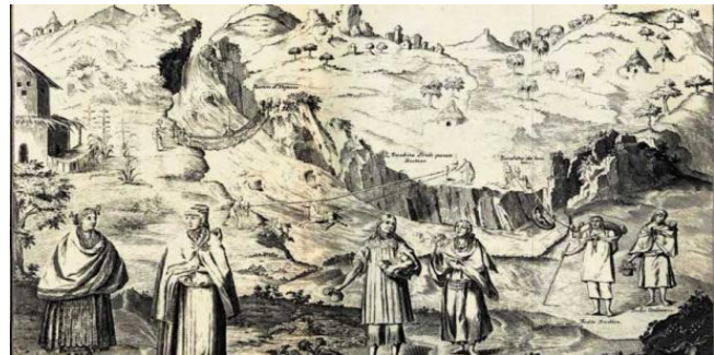
Ilustración 10 - IMAGEN IDEALIZADA DE UN CORREGIMIENTO

5.- Corregimientos: eran subdivisiones más pequeñas de los virreinos o gobernaciones. Eran lo que en la actualidad nosotros llamamos regiones en nuestro país. Chile de norte a sur en la época colonial fue subdividido en 11 corregimientos. Los corregidores eran nombrados por el gobernador y tenían las mismas atribuciones del gobernador en el plano local, pero siempre bajo la autoridad del gobernador. Se mantenían en el cargo un año, pero su mandato se podía extender hasta 5 años, los mismos que el gobernador se mantenía en el cargo.