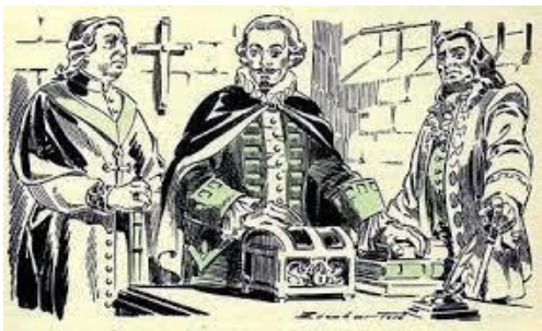
Ilustración 7 - FUNCIONARIOS DE LA REAL HACIENDA

En Chile la real audiencia fue instalada por primera vez en 1565 en la ciudad de Concepción, luego en 1573 fue eliminada, se volvió a establecer en 1604, siendo suprimida definitivamente en 1811 cuando Chile iniciaba su camino hacia la independencia.