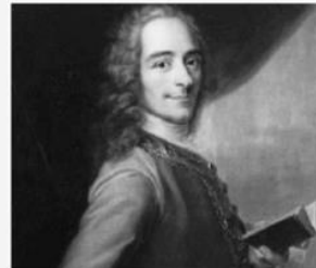
Francois M. Voltaire

Escritor ilustrado francés, se enfocó en escribir sobre la tolerancia y el libre pensamiento. Fue un fuerte detractor de la imposición religiosa.