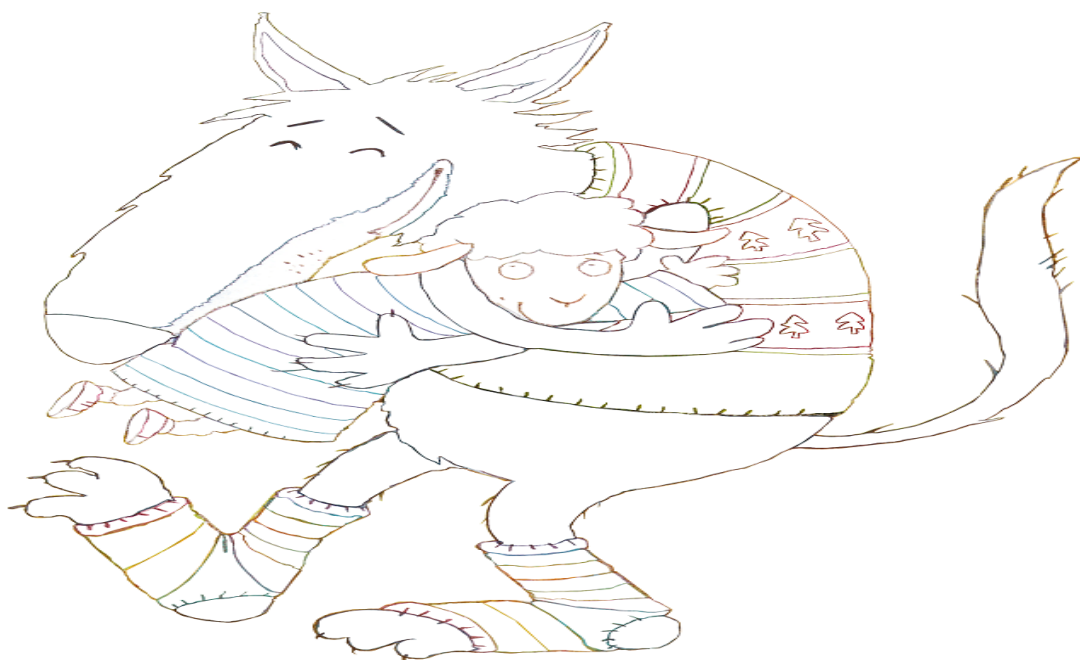
COLOREA EL ABRAZO DE LOBO Y OVEJITA